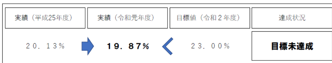
図 2-2-2 リサイクル率

資源物の分別に関しては、ごみ組成分析調査によると、集積所に排出される可燃ごみには湿重量比で約10%と、まだ多くの資源物が含まれており、資源化量を増加させるためには、可燃ごみに含まれる資源物を適正に分別して排出していただくための取り組みを進めていく必要があります。