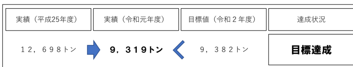
図 2-2-3 最終処分量

また、釧路市のごみの最終処分の主たる役割を担っている釧路市新高山最終処分場の残余容量が、令和6年3月に埋立完了の見通しのため、現在、令和6年度からの供用開始に向け次期最終処分場の整備を進めています。最終処分場の整備には、多額の費用が必要となることから、施設の延命化の観点からも更なるごみの減量化への取り組みを進めていく必要があります。