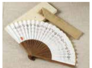
アイヌ文様入り富貴紙扇子