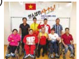
釧路を訪れたベトナム選手団