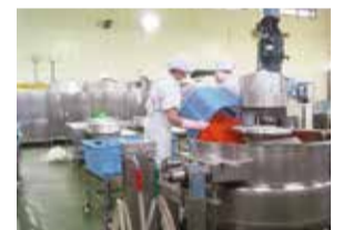
現在の学校給食センター内