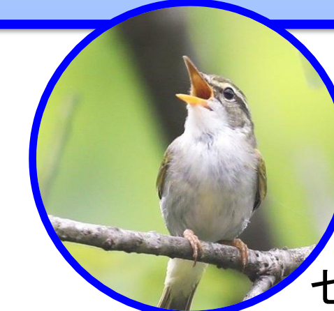
センダイムシクイ