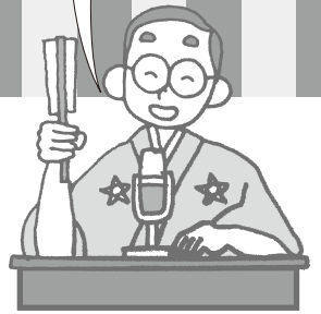
問合せ 市役所財政課（☎31-4512）

今月号は市の特別会計である「介護保険特別会計（保険事業勘定）」について説明します。