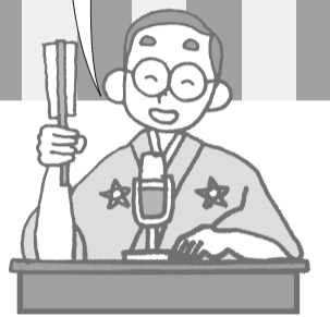
問合せ 市役所財政課 (☎31-4512)