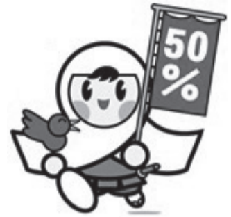
▲がん検診受診率50パーセント達成に向けたイメージキャラクター「けんしんくん」

市では無料クーポン券によるがん検診以外にも、胃がん・肺がん・大腸がん・子宮頸がん・乳がんの5つのがん検診を実施しています(詳しくは下記をご覧ください)。胃がん・肺がん・大腸がん検診は毎年、子宮頸がん・乳がん検診は2年に1回、継続的に検診を受けましょう！