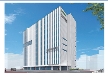
新しい図書館が入居予定の民間ビル完成予想図