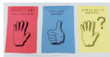
コミュニケーションカード