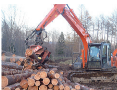
木材積み込みの様子