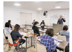
再就職支援講座の様子