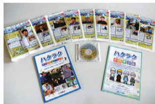
建設業の魅力をもとめたパンフレット「ハタラク」