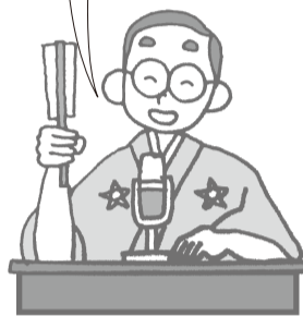
問合せ先 市役所財政課 (☎31-4512)

市では、市民の皆さんが健康で文化的な生活を営む上で必要とする健全で恵み豊かな環境を確保し、将来の世代へ継承していくための取り組みを行っています。