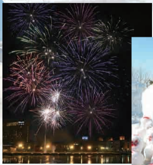
くしろ石炭雪だるまを作ろう