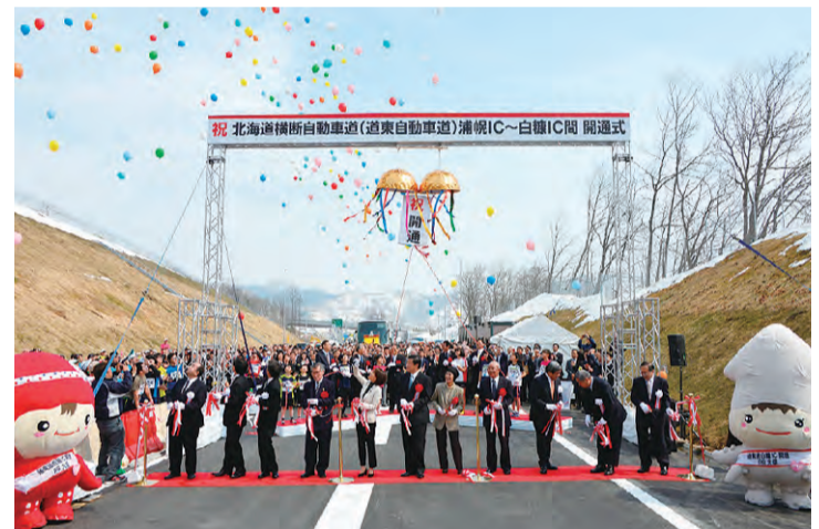
昨年の白糠IC開通式の様子