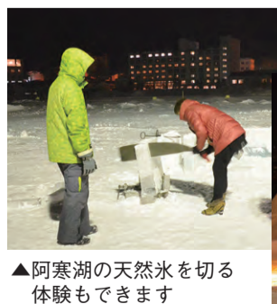
▲阿寒湖の天然氷を切る体験もできます