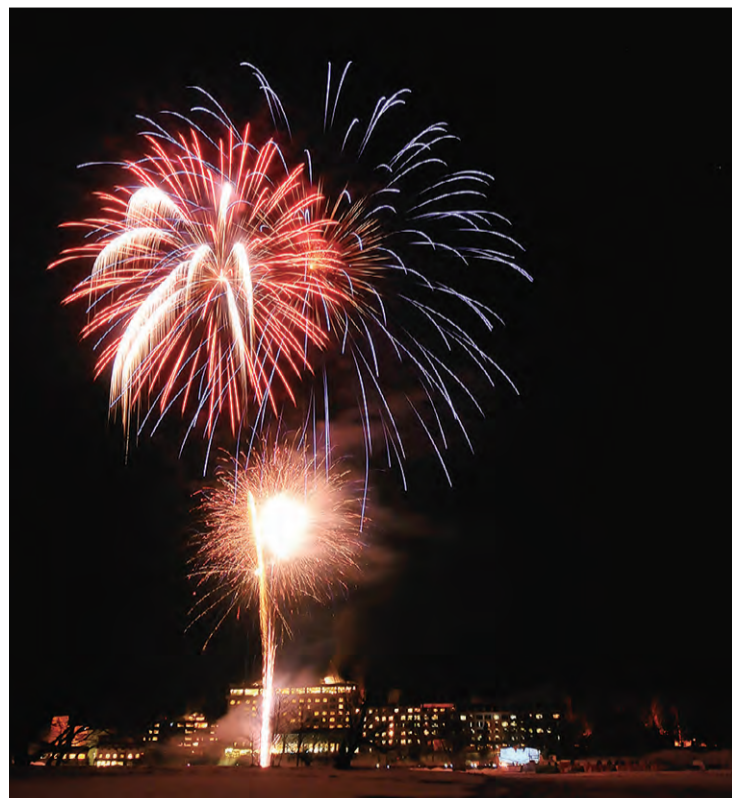
透き通った夜空を染める「冬華美」