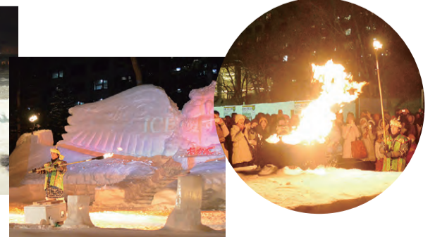
▲シマフクロウのステージで繰り広げられるミニステージ