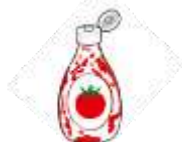
汚れが落ちないもの