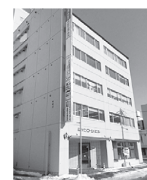
水色のビルが目印です 釧路駅より徒歩5分