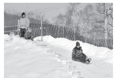
▲雪山で遊べる冬遊びの体験コーナーも人気でした