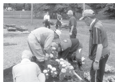
▲サークルハウス赤いベレーやキャンプ場にかけて花畑にする取り組みをしています

新たな魅力の創出として、サークルハウス赤いベレー敷地内に、夏場における賑わいの場や、冬場における冬遊び体験コーナーの設置などを行っています。また、地域野菜を使ったドレッシングの商品化を目指し、特産品開発を担う人材育成に取り組んでいます。