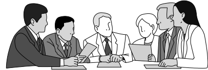
地域懇談会など説明に伺います。

説明は、事務局が合併協議を進めていくための基礎資料として作成した、「新市将来構想」「行政財政シミュレーション」「行政現況基礎調査」のダイジェスト版をもとに行われ、3月20日の音別町をはじめ、4月4日の鶴居村まで、879人の住民の皆さまが参加され、釧路市では、3月25日から28日まで「コア大空」「コア鳥取」「コアかがやき」「交流プラザさいわい」の4カ所で行われ、172人の皆さまに参加いただきました。