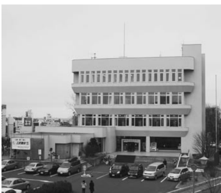
指定管理者制度が導入される市立図書館

られ、教育長は、報告・連絡・相談については、常日頃、指示をしていたが、結果として今回、市民の皆様には不信感や誤解を与え、議会を混乱させたことは、市教育委員会内部の連携のまずさであり、深く反省している。今後の図書館行政の執行に当たり、市民意見を踏まえ、あるべき図書館像をつくり上げていきたいと答えました。