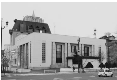
施設の跡利用が注目される日銀釧路支店

○ 財政状況から購入は十分な検討が必要である。跡利用については日銀と相談したい。