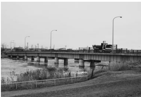
経済・生活道路に利用されている新川橋

○ 港湾協会から示された取扱貨物量の確保を目標に、積極的なポートセールス等により、収支の均衡を目指したい。