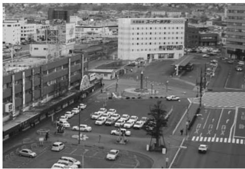
再整備へ向けた協議が継続される釧路駅周辺

駅周辺再整備の事業手法の 決定は、集中改革プランの期 間終了以降に、一定の判断が 想定されるが、今後どう取り 組むのか質問がありました。