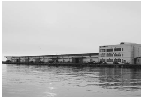
会計手法の検討が求められた市設魚揚場

市設魚揚場事業会計のあり方 当面は企業会計を継続 18年度の企業会計決算は、 特別委員会を設置し、審査を 行いました。