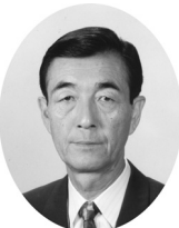
音別町長 高野 武

ここまでに至る経緯を考えますと感慨深いものがあり、本格的な合併を前提とした協議のスタートとなった今、責任の重大さを感じております。これからは、住民の立場に立った議論とその過程をしっかり説明し、理解が得られるよう、最善を尽くして参りたいと思っておりますので、よろしくお願い申し上げます。