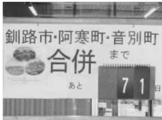
カウントダウンボードが設置されています