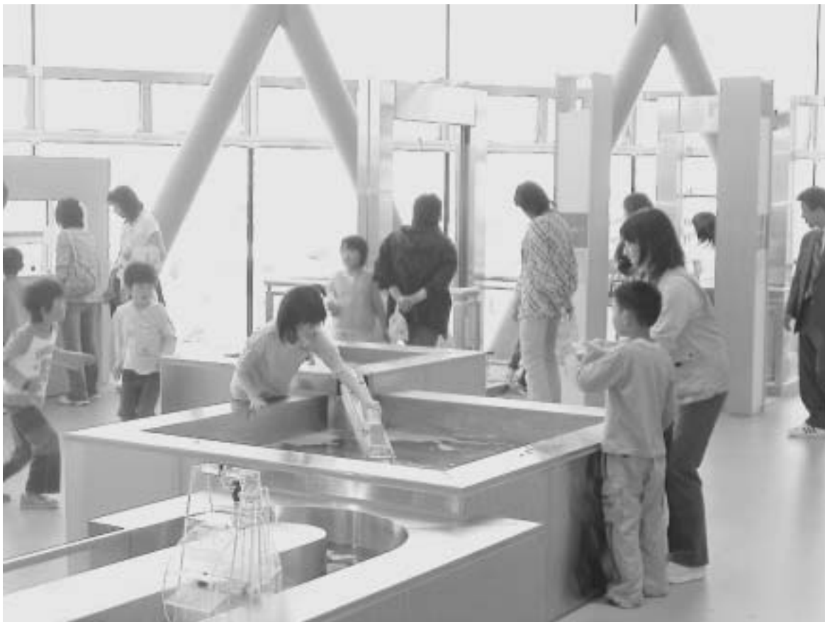
新しい展示物を楽しむ子どもたち（釧路市子ども遊学館）