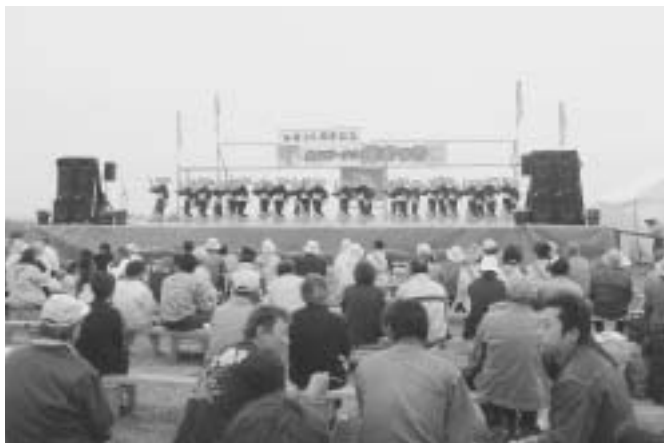
分村90周年記念 北のビーナスまつり(音別町)