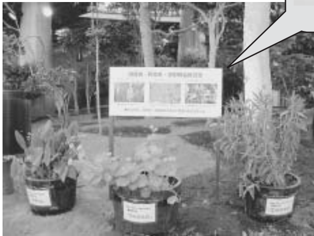
設置された3市町の花のプランター