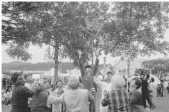
3市町合併記念 第24回阿寒町ふるさとまつり(阿寒町)

7月3日(日)、阿寒町では「3市町合併記念 第24回阿寒町ふるさとまつり」が、音別町では「分村90周年記念 北のビーナスまつり」がそれぞれ開催されました。