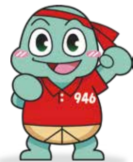
釧路市 介護予防普及啓発キャラクター 「まんねん」