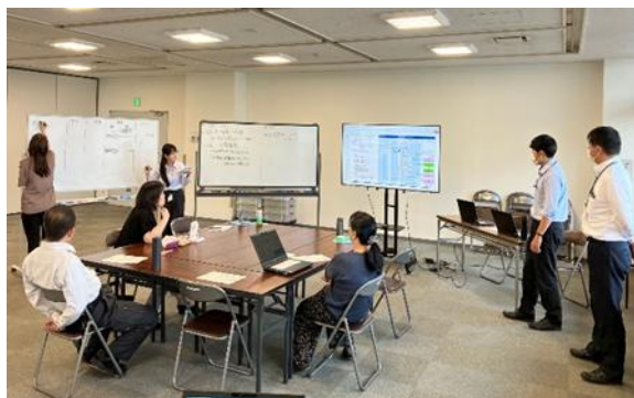
BPR（業務改善）研修会の様子

釧路市DX実行計画に基づく、行政手続きのオンライン化やデジタル・デバイド対策、庁内業務改善や職場環境整備 等