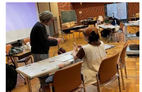
アイヌ文化体験講座の様子