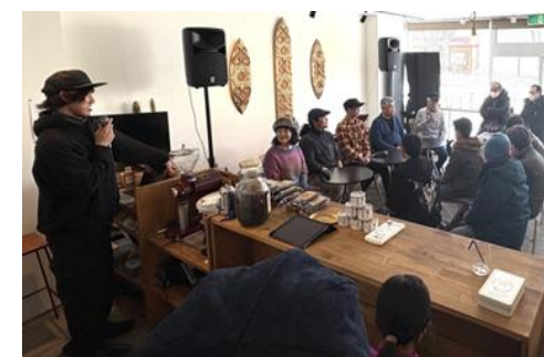
阿寒町交流拠点「F u u .」でのイベントの様子

阿寒地区・音別地区における地域おこし協力隊制度を活用した地域への定住・定着促進、魅力発掘・情報発信、地域内外の交流促進を目的とした拠点の運営、空き家等の利活用の取組 等