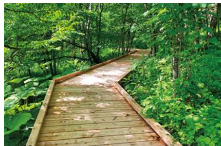
湿原展望台遊歩道