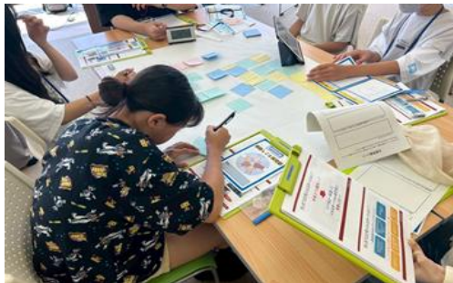
「釧路しごと探究部」 グループワークの様子

起業に関する支援、小中学生等を対象とする起業体験プログラム「釧路しごと探究部」の実施、新たにオープンネームマッチングサイトや地域おこし協力隊を活用した事業承継支援