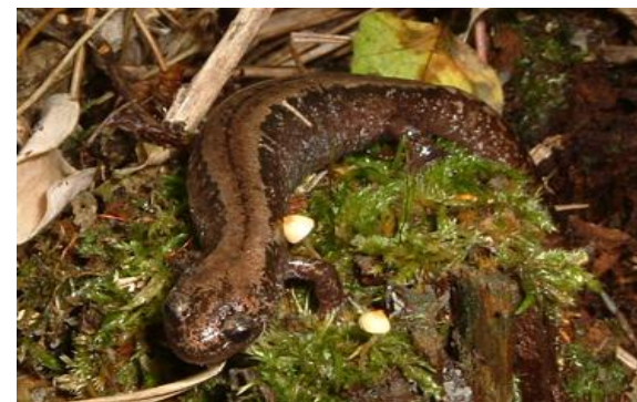
釧路市天然記念物 （キタサンショウウオ）

キタサンショウウオ保護のための産卵調査の拡充、新たに「（仮称）キタサンショウウオ保護ガイドライン」の策定等