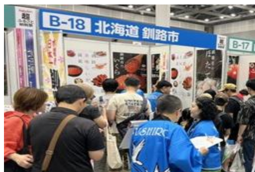
楽天超ふるさと納税祭の様子

返礼品の拡充、寄附者への釧路市PR、寄附金活用状況の報告、ふるさと納税推進業務委託（寄附額 27億円）、企業版ふるさと納税推進業務委託 等