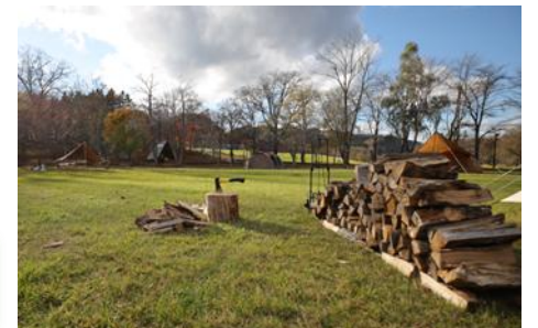
キャンプ場テントサイト