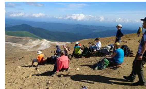
ガイドツアーによる 雌阿寒岳トレッキング