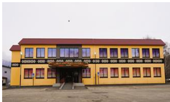
阿寒アイヌクラフトセンター

「阿寒アイヌクラフトセンター」を活動拠点としたアイヌ工芸等担い手育成のための研修事業の実施 等