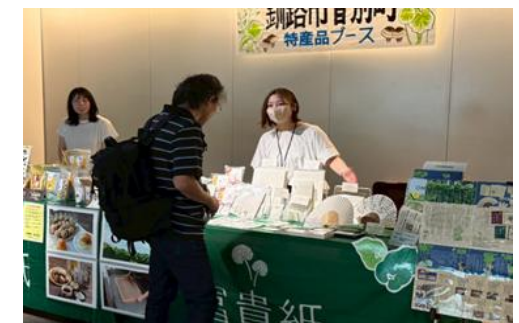
富貴紙PR活動の様子