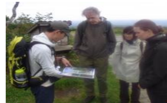
専門人材の活動状況

地域プロジェクトマネージャー制度を活用した専門人材の配置による地域連携DMO（釧路観光コンベンション協会）の推進体制強化