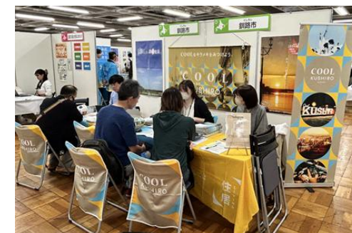
北海道移住・交流フェア（東京会場）での相談対応の様子

民間事業者との連携による二地域居住等の促進に向けたPRや受入環境整備、新たに地域おこし協力隊制度を活用した二地域居住等促進戦略に係る事業の推進