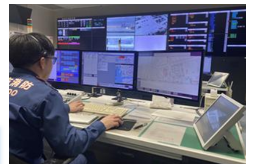
高機能消防指令施設