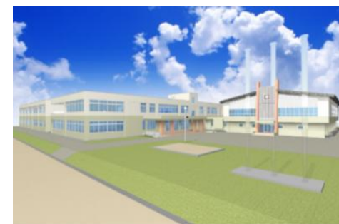
音別義務教育学校完成イメージ