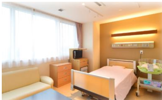
総合病院釧路赤十字病院

産後1年未満の母子への心身のケアや育児のサポートを市立釧路総合病院及びママケアハウス イコロ助産院、新たに総合病院釧路赤十字病院との連携により実施