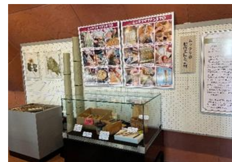
企画展開催の様子

釧路のアイヌ文化を紹介する企画展等の開催、アイヌ文化体験講座の実施、授業等で活用するアイヌ文化トランクキット（貸出用資料）の製作