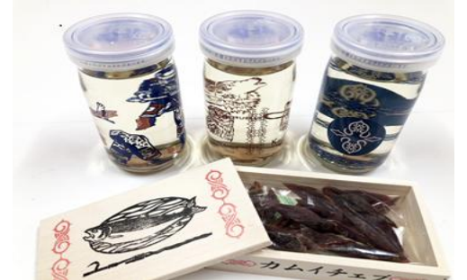
アイヌ文様入り商品開発制作例