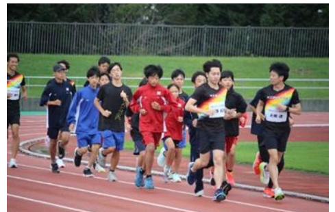
合宿支援市民団体による陸上教室

スポーツ合宿の誘致活動、合宿支援市民団体への助成、新たに地域おこし協力隊制度を活用した合宿受入態勢の強化 等