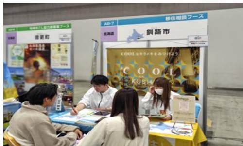
J O I N移住・交流&地域おこしフェア2025 相談対応の様子

U I J ターン支援金及び移住支援金による支援、移住フェアへの出展、就職個別相談会の開催によるU I J ターン就職の促進、新たに地域おこし協力隊の活用によるU I J ターン就職マッチング制度の強化・運用