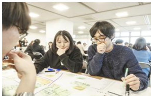
市民ワークショップ開催の様子

釧路市全体のブランド化を目的とした、市民参加型ワークショップの実施、その内容を踏まえたマーケティング戦略・ロゴ・キャッチコピーの作成、プロモーションの実施 等