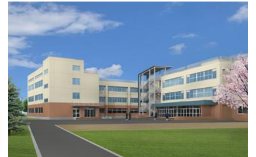
大楽毛学園完成イメージ