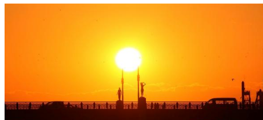
釧路市の夕日は世界三大夕日のひとつ