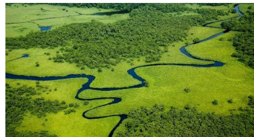
日本最大の湿原である「釧路湿原国立公園」