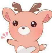
マスコットキャラクター「ここまる」

こども家庭センターは 子どもに関する相談・ 支援を一体的に行う仕組 みです。ママとパパが子 育てに前向きになれるよ う、市や関係機関がまるっ とサポートします！