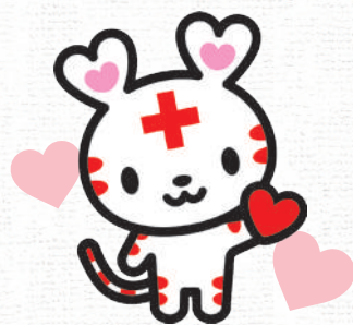
日本赤十字社公式キャラクター 「ハートちゃん」