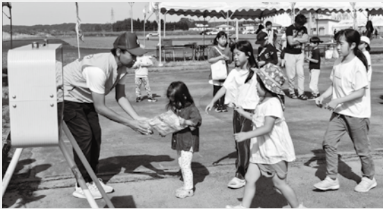
▲子ども抽選会の様子

イベントの最後に行われた「お楽しみ抽選会」では、景品があたるたびに歓声があがり会場は大いに盛り上がりました。