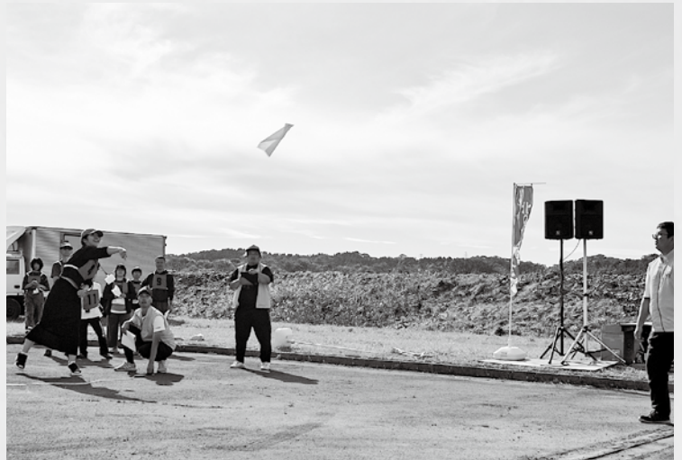
▲フキ飛ばせ!! 富貴紙ヒコーキ〜和紙が一番!!〜の様子