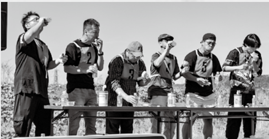
▲しいカツチャンピオンシップの様子