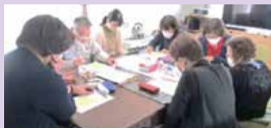
みんなで考えたり...