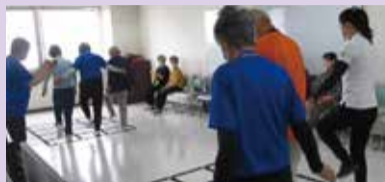
ストレッチや筋力トレーニング