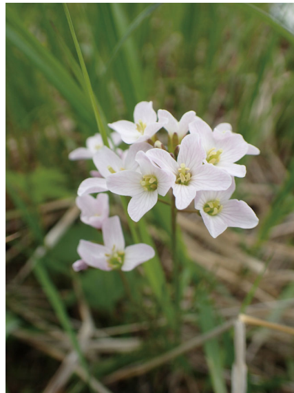
ハナタネツケバナ