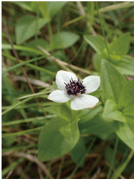
エゾゴゼンタチバナ