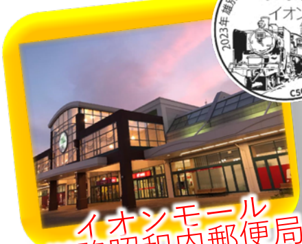
イオンモール 釧路昭和内郵便局