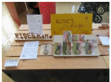
⑨キーホルダー (新規)