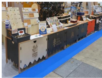
④まちまちテーブル (新規)