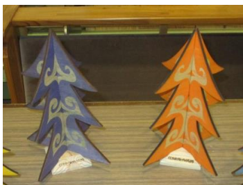
⑩カラマツリー (新規)