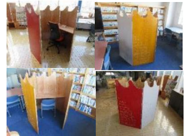
③パーソナルワーキングスペース (改良)