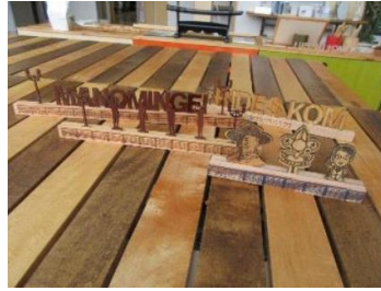
②ネームサイン (改良)