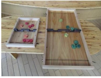
①シューティングゲーム (改良)