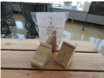
⑦スマホスタンド (新規)