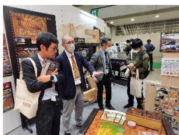
丸善木材(株)・厚浜木材加工協同組合

全国規模のイベントに出展することにより、釧路発の林業・木材産業を域外に知っていただく良い PR の場となりました。くしろ木づなプロジェクトでは、このようなイベントを通じて地域材利用拡大に向けて、今後も引き続き取組を進めていきたいと考えています。