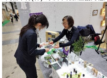
(一社) 摩周湖観光協会