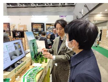
エステー(株)・(株)北都