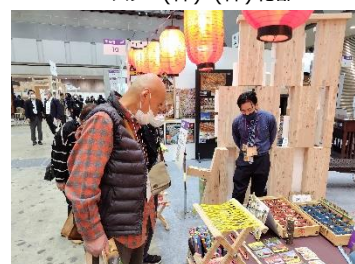
釧路森林資源活用円卓会議