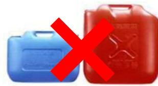
ガソリンの貯蔵に適さない容器の例 (樹脂製容器は火災危険性が高い)