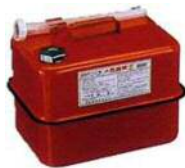
ガソリンの貯蔵に適した容器の例 (金属製容器であることが必要)