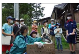
こどもレンジャーの活動