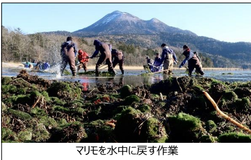
マリモを水中に戻す作業

また、大学などと共同研究したマリモの年成長率に関する知見が国際学術誌に掲載されました。