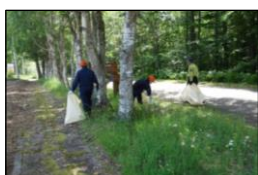
クリーンデーの活動

自然保護思想の普及啓発を図るため、温根内ビジターセンターと塘路湖エコミュージアムセンターを拠点に、自然ふれあい活動を月に2～4回実施しています。また、釧路管内在住の子どもを対象とした「こどもレンジャー」登録制度を設け、自然観察や工作などの活動を行うほか、国立公園の美化清掃活動を毎年実施しています。さらに、釧路湿原国立公園のガイドブックやホームページ、SNSなどにより、釧路湿原国立公園に関する情報などを提供しています。