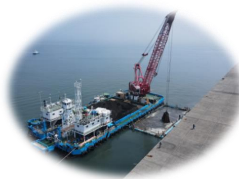
港湾整備事業の様子