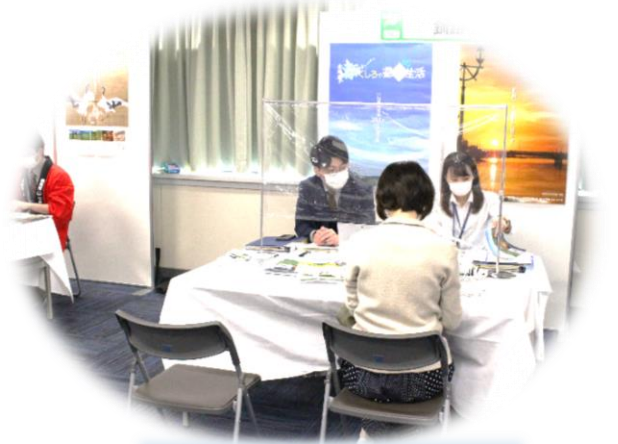
移住・交流フェアの様子