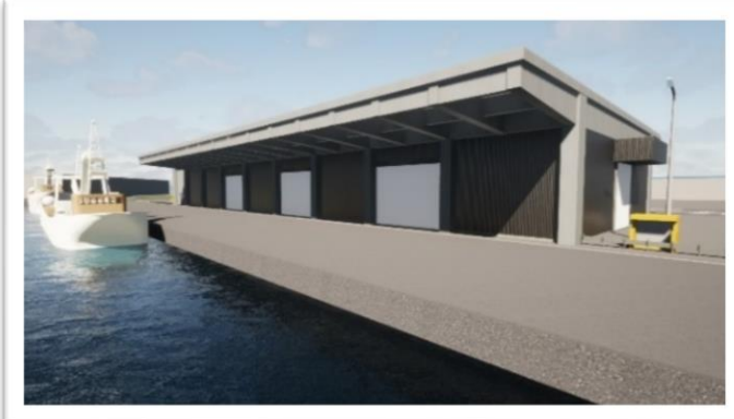
（仮称）第8魚揚場 完成イメージ