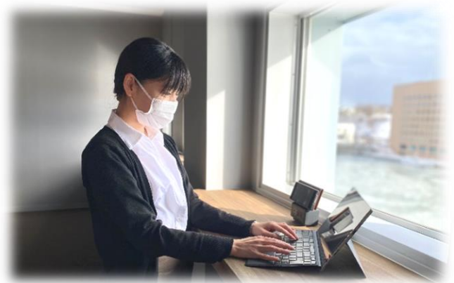
眼下に流れる釧路川を眺めながらテレワーク

■テレワーク等推進事業（952万円） WEB等各媒体を使ったワーケーションなどの情報発信、首都圏等の企業へのトップセールス、企業とのマッチングイベントの参加等