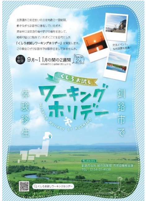
くしろお試しワーキングホリデー事業のPRチラシ

□移住定住・長期滞在促進事業（436万円） 民間事業者との連携による長期滞在・移住に向けたPRや受入環境整備、若年層を対象とした移住促進のための「くしろお試しワーキングホリデー事業」の実施等