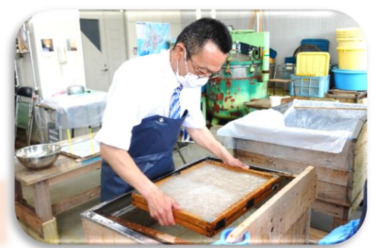
地域おこし協力隊による富貴紙漉き