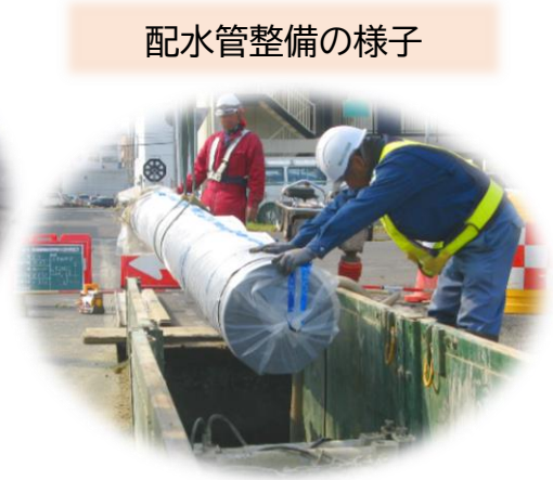
配水管整備の様子