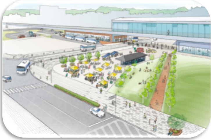
釧路駅周辺 (ゲートウェイ) 南側イメージ

ひがし北海道の中核都市として、賑わいの創出と拠点機能の充実を図るため、まちの顔である都心部を車優先から人と公共交通が中心となる、歩いて暮らせる空間に変える基盤整備を推進