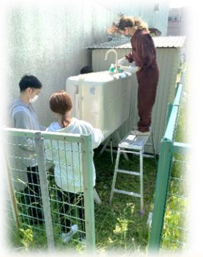
灯油タンク塗装作業の様子