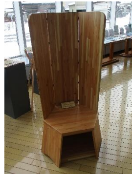
③覗かれづらい椅子