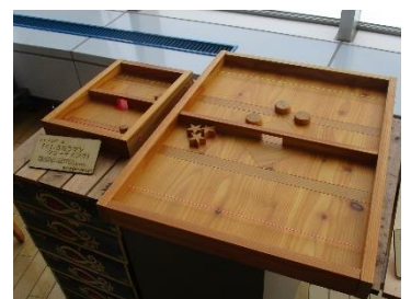
⑬くしろカラマツシューティング