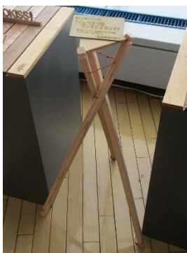
⑭ランタンスタンド