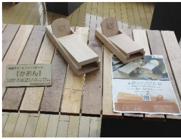
⑤鉋型スマホスピーカー「かおん」