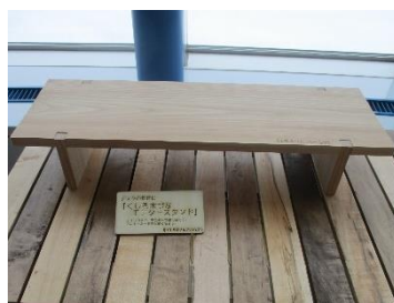
⑫モニタースタンド