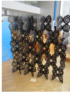
②モレウパーティション