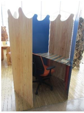
①プライベートワーキングブース