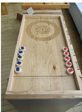
⑮くしろカラマツカーリング