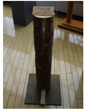
④アルコールスタンド