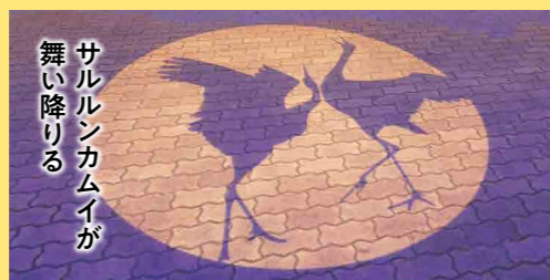
サルルンカムイが 舞い降りる