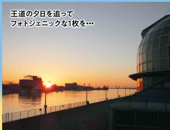
王道の夕日を追って フォトジェニックな1枚を...