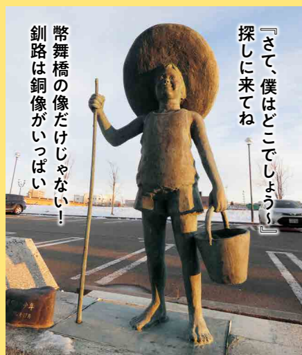
幣舞橋の像だけじゃない! 釧路は銅像がいっぱい! 「さて、僕はどこでしよう!」 探しに来てね