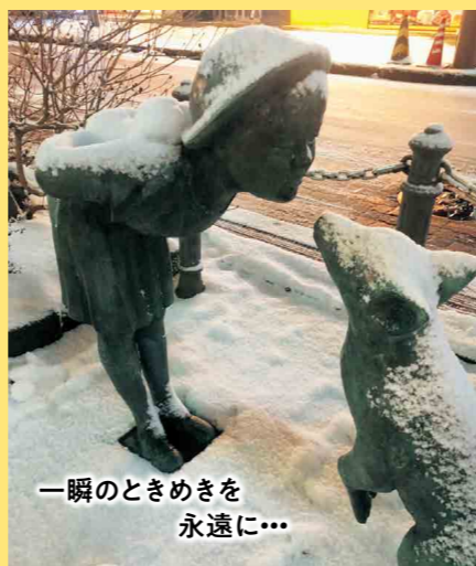
一瞬のときめきを 永遠に...