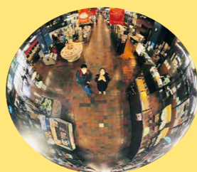
まあるい大きなミラーを 探して #セカイトリ