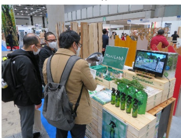
エステー(株)・(株)北都