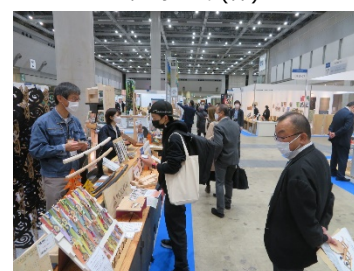
釧路森林資源活用円卓会議