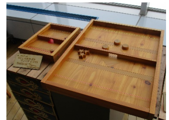
くしろカラマツシューティング