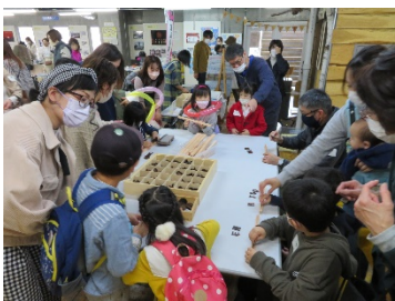
ネームサイン作り