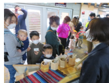
まちまちえんぴつさんも出店