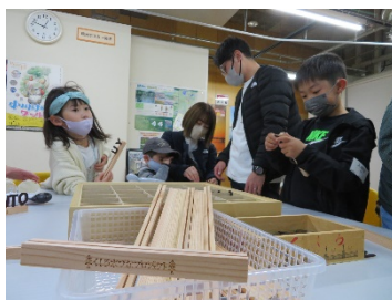
ネームサイン作り