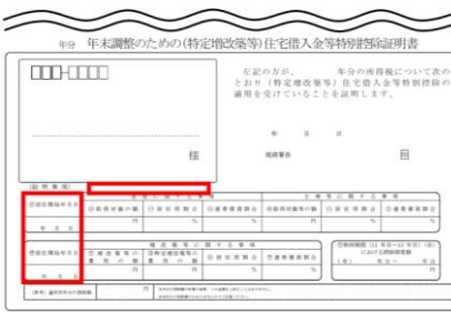
【居住開始が平成31年1月1日以後の場合】