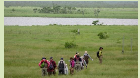
【長期滞在者向け釧路湿原ウォークの開催】