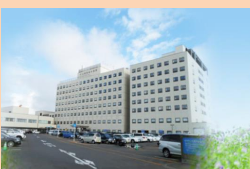
【釧路・根室三次医療圏の中核を担う市立釧路総合病院の医療体制の充実】