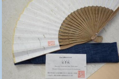
【フキを利用した伝統の富貴紙商品の開発】