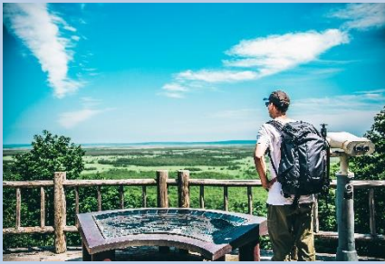
【釧路湿原やアイヌ文化を生かした観光地域づくり】