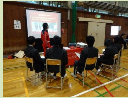
【地元企業を紹介する説明会の開催】