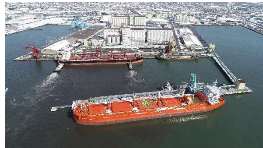
【釧路港の開発整備促進】