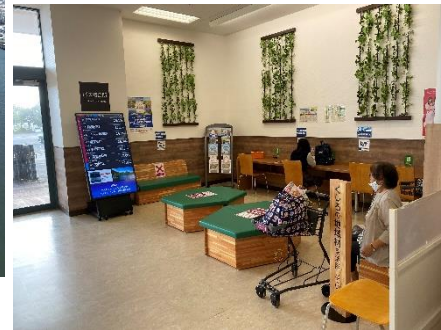
【公共交通の維持確保と再構築～バス待合環境の整備等】