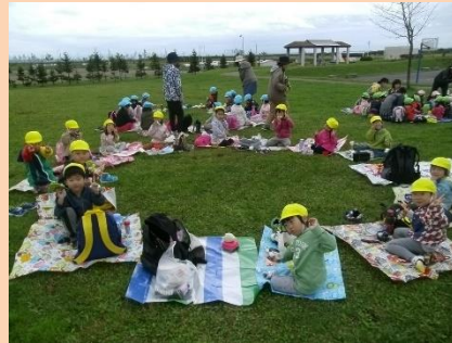
【子どもの健やかな成長に資する教育環境の充実】