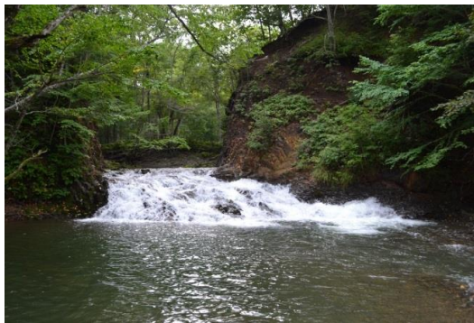
小音別川上流の滝(道路幅が狭い為、通行には十分お気を付け下さい。大型車両通行不可、冬期間通行止め)