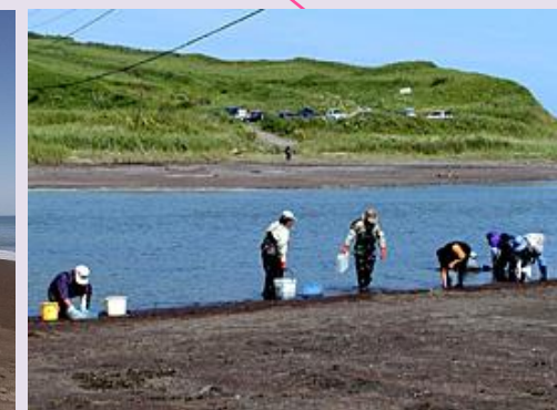
パンクル沼のシジミ採り