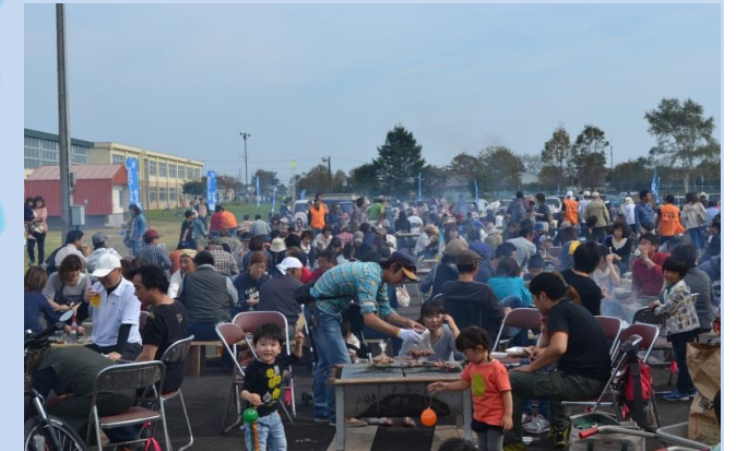
10月 北のビーナスBBQまつり