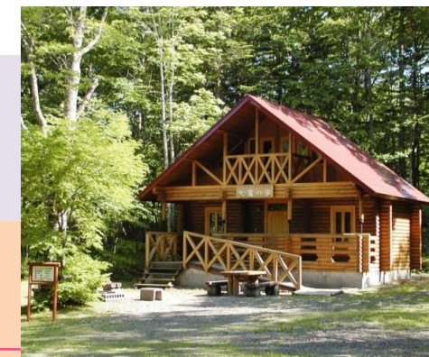
憩いの森キャンプ場

20人収容のバンガローをはじめ、4棟のバンガローがあります。テントサイトは無料、バーベキューコーナーも整っています。