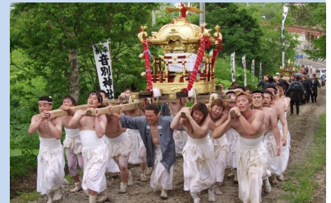
7月 音別神社例大祭