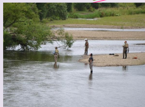
音別川・アメマス釣り