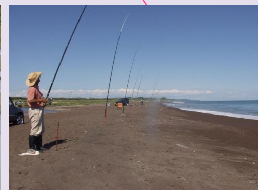
音別海岸・サケ釣り