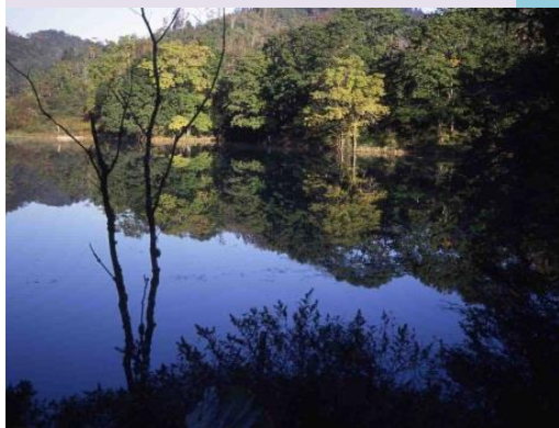
三滝の沼(道路幅が狭い為、通行には十分お気を付け下さい。大型車両通行不可、冬期間通行止め)