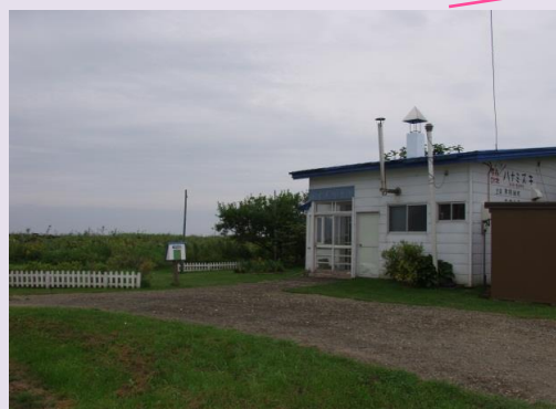
映画「ハナミズキ」ロケ地