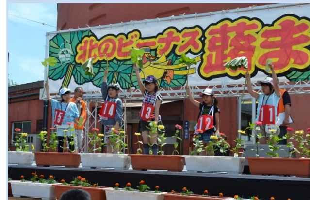
6月 北のビーナス落まつり