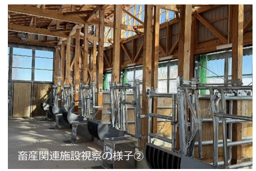
畜産関連施設視察の様子②