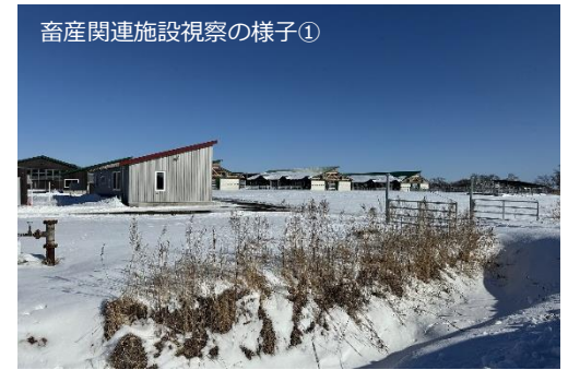
畜産関連施設視察の様子①