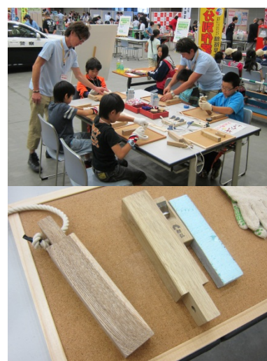
▲ (上) 木工作品づくり体験 (下) 製作する拍子木 (加工前)

https://www.city.kushiro.lg.jp/kyouiku/kyouiku/seishonenikusei/page00015.html