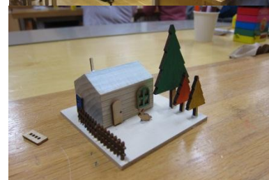
▲上 2 つ「木育講座」 下 2 つ「木工作体験」