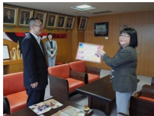
園児から心のこもったお礼の寄せ書きも