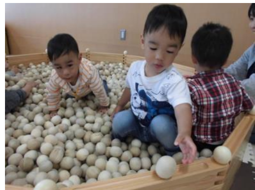
「木の玉プール」で遊ぶ園児たち