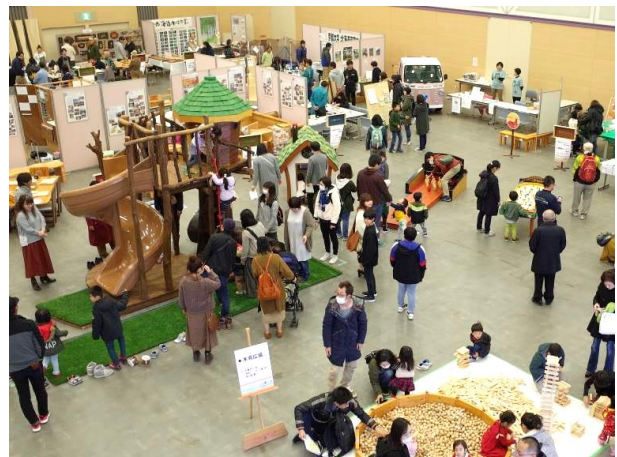
木育広場と様々な団体・企業の出展ブース