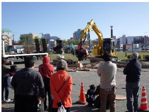
市街地でのハーベスター実演は迫力満点