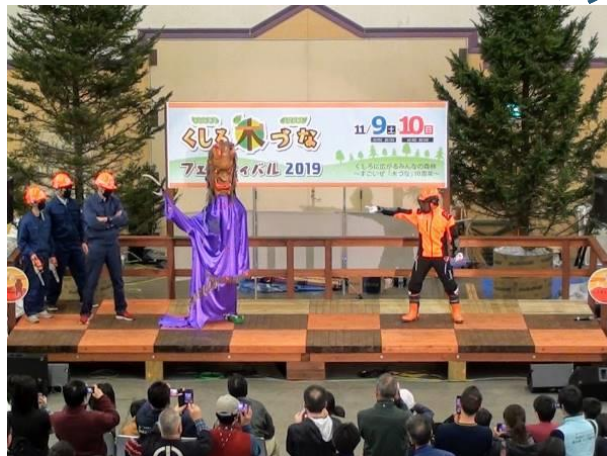
「森林戦士セバスチャン」ショー

【主催】 くしろ木づなフェスティバル実行委員会（釧路市、釧路森林資源活用円卓会議）