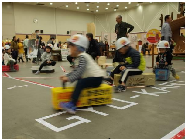
魚箱 ぎょ の新たな活用「魚～カート」