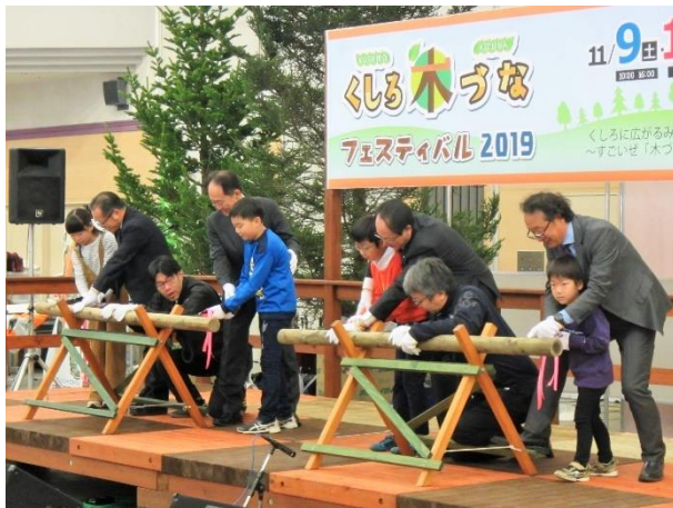
オープニングは丸太カットで

今回のイベント開催に当たり、多くの団体・企業に関わっていただいた結果、釧路地域のみなさんの「木づな」を深めることができました。今後もより多くのみなさんと林業・木材産業が抱える課題を共有し、「くしろ木づなプロジェクト」を展開し、課題解決に向けて取り組みたいと考えております。