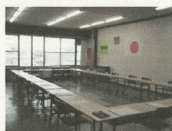
↑釧路総合振興局の 会議机 製作：釧路建具家具生産協同組合