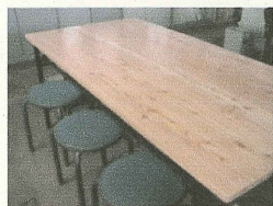
↑釧路総合振興局の 打合せテーブル 製作：釧路建具家具生産協同組合