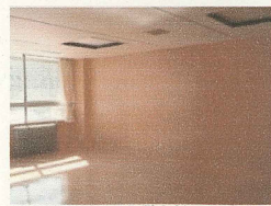
↑釧路市役所秘書課の フローリング、壁材 製作：札幌ベニヤ株式会社