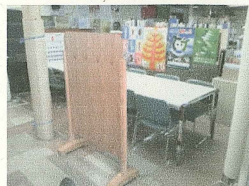
↑釧路市役所の 執務室パーティション 製作：釧路建具家具生産協同組合