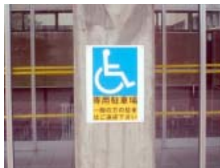
▲ 市役所身障者用駐車場サイン