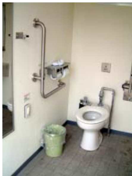
▲ 栄町平和公園身障者用トイレ