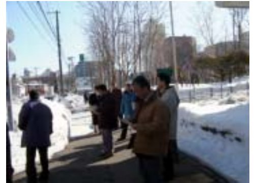
▲ 釧路市役所前の歩道