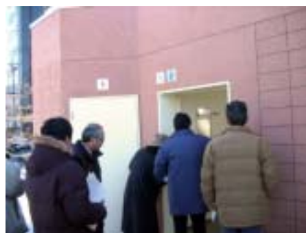
▲ 栄町平和公園のトイレ