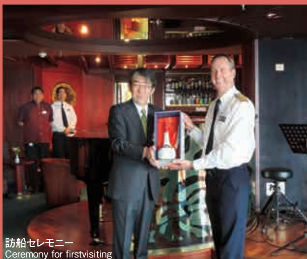
訪船セレモニー Ceremony for firstvisiting