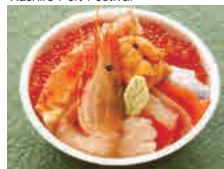
勝手丼 Bowl of Rice Topped with Seafoods; Katte-Don