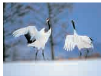
タンチョウ Japanese Crane; Tancho