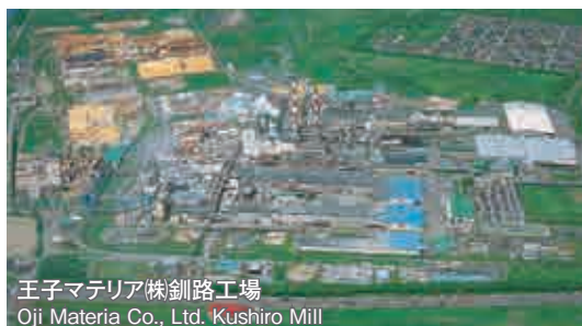
王子マテリア(株)釧路工場 Oji Materia Co., Ltd. Kushiro Mill