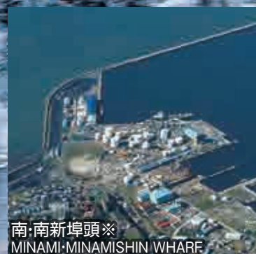
南・南新埠頭※ MINAMI:MINAMISHIN WHARF