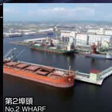
第2埠頭 No.2 WHARF