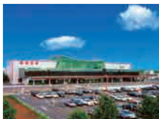
たんちょう釧路空港 Tancho Kushiro Airport

Such Kushiro nature and culture enjoy high acclaim across the world, and the area was selected as the venue of the Adventure Travel World Summit for the first time in Asia in 2021.