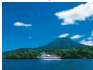
阿寒摩周国立公園 Akan-Mashu National Park