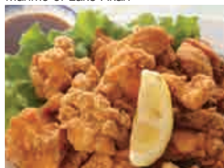
ザンギ Fried Chicken; Zangi