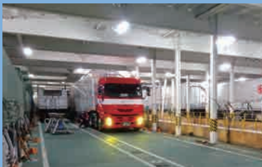
紙製品を運ぶRORO船 Roll-on/roll-off ship transporting paper products