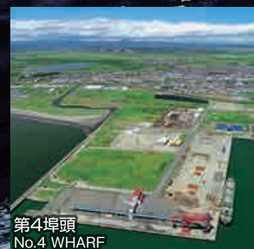
第4埠頭 No.4 WHARF