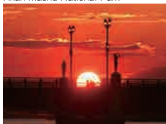
世界三大夕日 One of the World's Three Best Sunsets