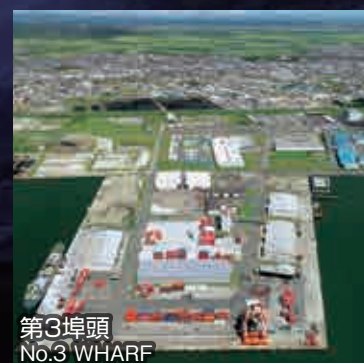
第3埠頭 No.3 WHARF