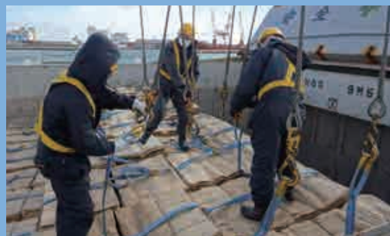
パルプの船内作業 Work on board of pulp