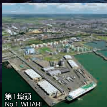
第1埠頭 No.1 WHARF

In line with the provisions of the Strategic International Port Management Measures, it is a national priority of Japan to improve its network of ports and harbors in order to expand and strengthen international and domestic logistics in response to increasing amounts of bulk cargo and to enhance the domestic distribution base for the promotion of multimodal transport. In its role as an international distribution hub, Kushiro Port is scheduled to undergo an intensive program of improvements to secure its international competitive edge.