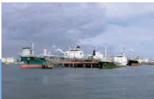
道東一円への石油供給基地 Oil supply base for the whole of eastern Hokkaido