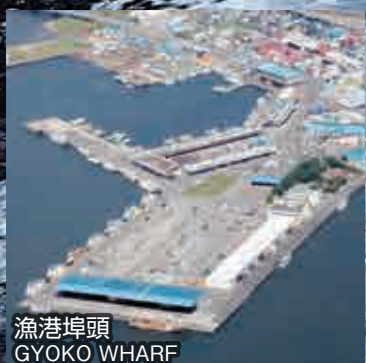
漁港埠頭 GYOKO WHARF