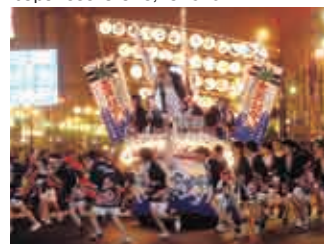
くしろ港まつり Kushiro Port Festival