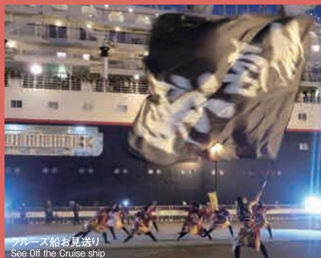
クルーズ船お見送り See Off the Cruise ship