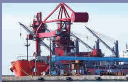
輸入石炭の陸揚げ Landing of imported coal