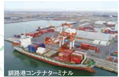
釧路港コンテナターミナル Port of Kushiro container terminal