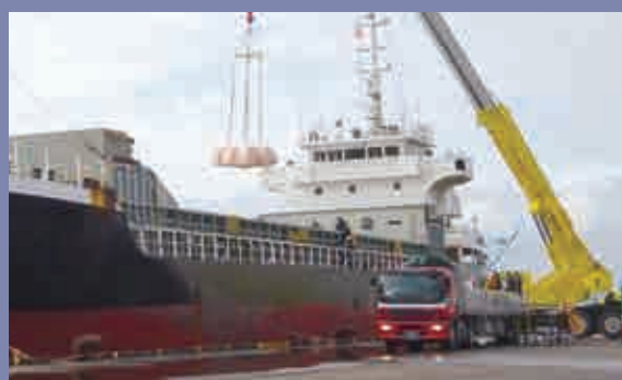
輸入肥料の陸揚げ Landing of imported fertilizer