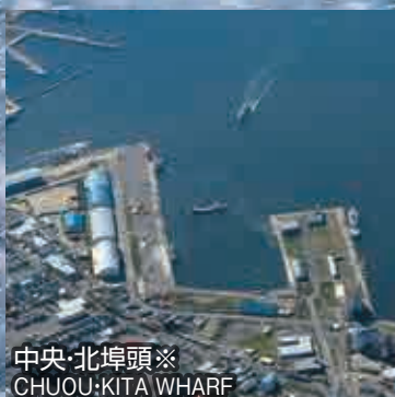
中央・北埠頭※ CHUOU:KITA WHARF