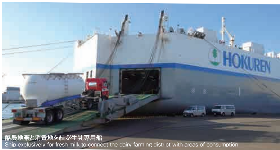
酪農地帯と消費地を結ぶ生乳専用船 Ship exclusively for fresh milk to connect the dairy farming district with areas of consumption

Transportation Networks Connecting Kushiro Port and the Rest of the Nation