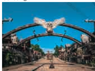
阿寒湖アイヌコタン Ainu Kotan in Lake Akan