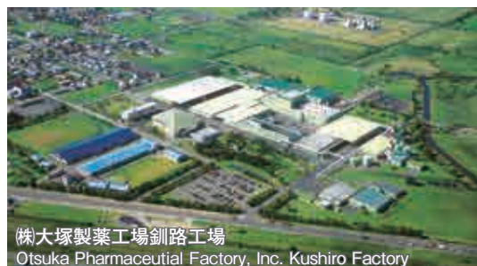
株大塚製薬工場釧路工場 Otsuka Pharmaceutical Factory, Inc. Kushiro Factory