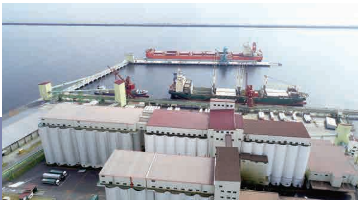
東北海道の酪農を支える輸入飼料 Imported feed to support dairy farming in eastern Hokkaido

A northern hub port with routes offering worldwide coverage 世界に広がる北の拠点港