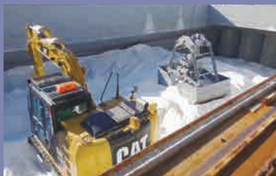
輸入塩の船内作業 Work on board of imported salt