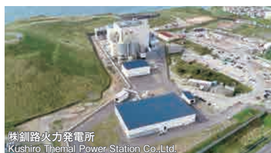
株釧路火力発電所 Kushiro Thermal Power Station Co.,Ltd.