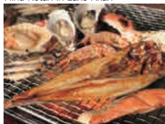
炉端焼き Barbecue; Robotayaki