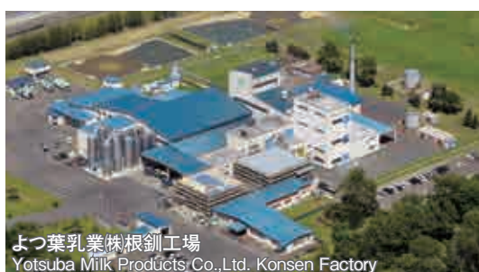
よつ葉乳業(株)根釧工場 Yotsuba Milk Products Co.,Ltd. Kosen Factory