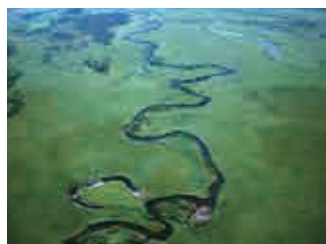
釧路湿原国立公園 Kushiro Shitsugen National Park