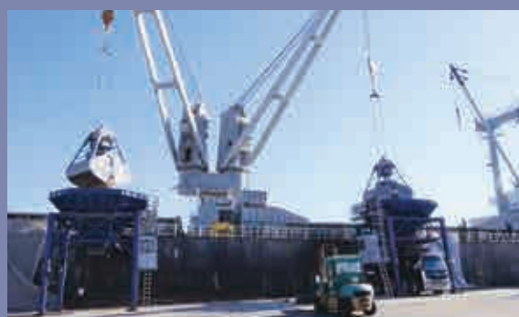
輸入助燃料の陸揚げ Landing of imported biomass fuel