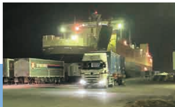
全国各地と結ぶ国内コンテナ船 Domestic container ship connecting Kushiro Port with the rest of the nation