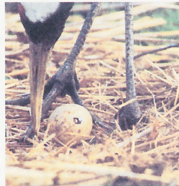
馬上就要誕生了 (漸漸看到幼鳥的嘴)